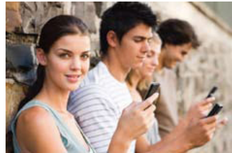
Es ist so einfach und bequem ein Taxi zu bestellen