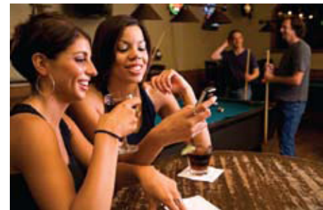
Ihre Kunden erhalten eine Auftragsbestätigung, Information zum Taxi und Ankunftszeit